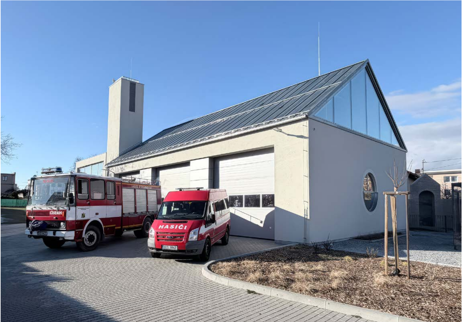
Nová hasičská zbrojnice v srdci obce je dokončena. Bude sloužit nejen hasičům, ale také veřejnosti.