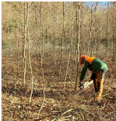
Prořezávka - nutný péstební zásah, rozhodující o stabilitě a kvalitě porostu

maximálně můžeme z lesa vytěžit dříví, tak aby byly trvale zajištěny veškeré funkce lesů. Je nutno podotknout, že údaje maximální výše těžby se vztahují v našem případě na celou lesní správu Opava a všechny její revíry a tvoří jakési spojené nádoby – je to proto, že pokud by došlo např. k živelné události a na jednom revíru by spadly tisíce kubíků dřeva, ostatní revíry zpravidla omezí těžbu, tak aby bylo možné rychle zpracovat poškozenou dřevní hmotu a nedošlo k zahlcení zpracovatelských kapacit a překročení zmiňované maximální výše těžby. Podobné omezení např. platilo v posledních letech u plánovaných těžeb, které se v rámci celé ČR na několik let v jehličnatém dříví zastavili, tak aby byla přednostně rychle zpracována kůrovcová kalamita napříč celou republikou. V současnosti již tato opatření neplatí, a proto se každý revír vrací k běžnému