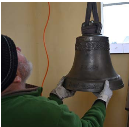
Nový zvon v kapli sv. Josefa ve Svobodě ...více na straně 12