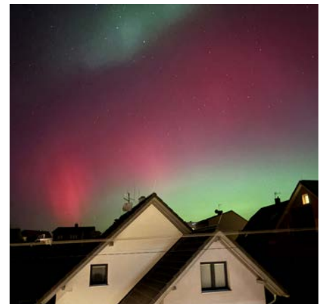
Polární záře viditelná i ve Štěpánkovících ...více na straně 29