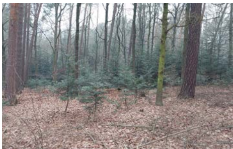
Úspěšná obnova jedle pod porostem