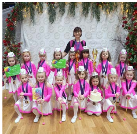
Sluníčka zazářila na Opavské růži 2026 ...více na straně 16