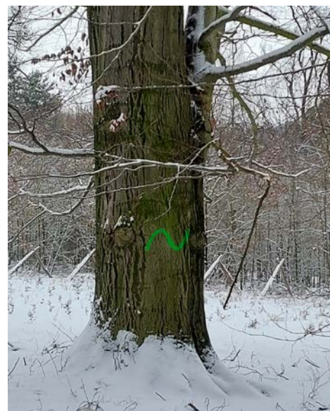
Označený biotopový strom, zůstane v lese do fáze svého rozkladu

Výše těžeb v lesích se určuje na základě zpracování tzv. Lesního hospodářského plánu, který se vyhotovuje jednou za deset let. Tento plán během několika měsíců měření vybraných veličin v lesích a zjišťování celkového stavu lesa vypracuje licencovaná taxační kancelář, během tvorby plánu se zpracovávají požadavky ochrany přírody, náměty samospráv, úřadů apod. Hospodářský plán je poté schvalován Krajským úřadem příslušného kraje. Po schválení je plán pro vlastníka ze zákona závazný především v maximální výši těžby, minimálním plošném rozsahu výchovných zásahů do 40 let věku (prořezávky, probírky) a minimálním podílem melioračních a zpevňujících dřevin v obnově porostů. Lesní hospodářský plán nám tedy na dobu deseti let říká, kolik