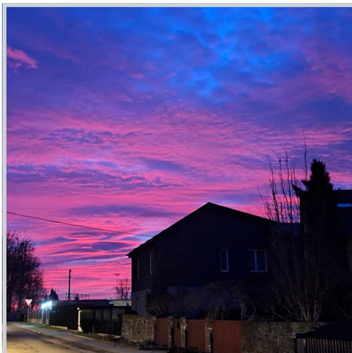
Oblohu však umí zbarvit do překrásných barevných odstínů i jiné jevy než polární záře.