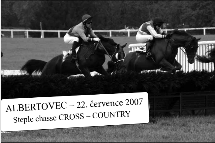
ALBERTOVEC – 22. července 2007 Steple chasse CROSS – COUNTRY

Už se opět stalo tradicí, že se na závodišti Hřebčína Albertovec pořádá během roku několik dostihových dnů.