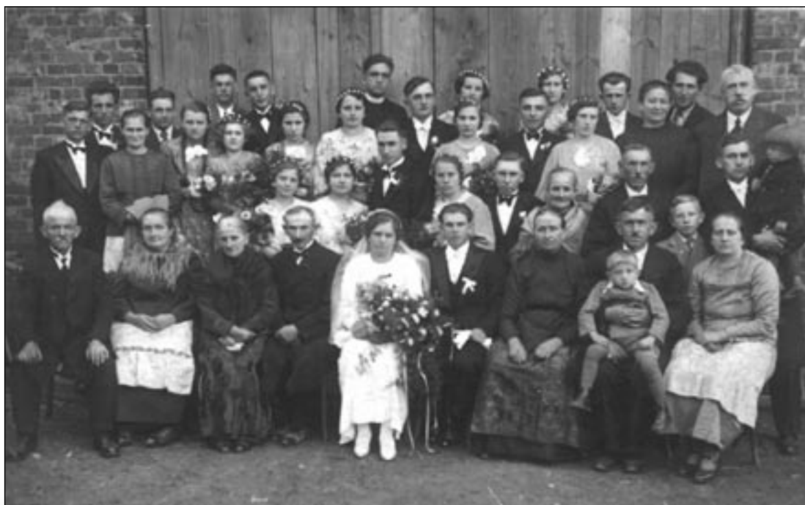
Tato fotografie byla pořízena kolem roku 1935. Poznáte kdo je na ní vyfocen?

Máte-li nějakou starší fotografii a chcete ji otisknout v našem zpravodaji, doneste ji na obecní úřad s popisem a my ji v nejbližším možném čísle uveřejníme.